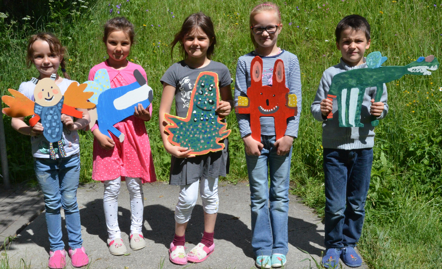
1. Klasse Grundschule - Schuljahr 2015/2016