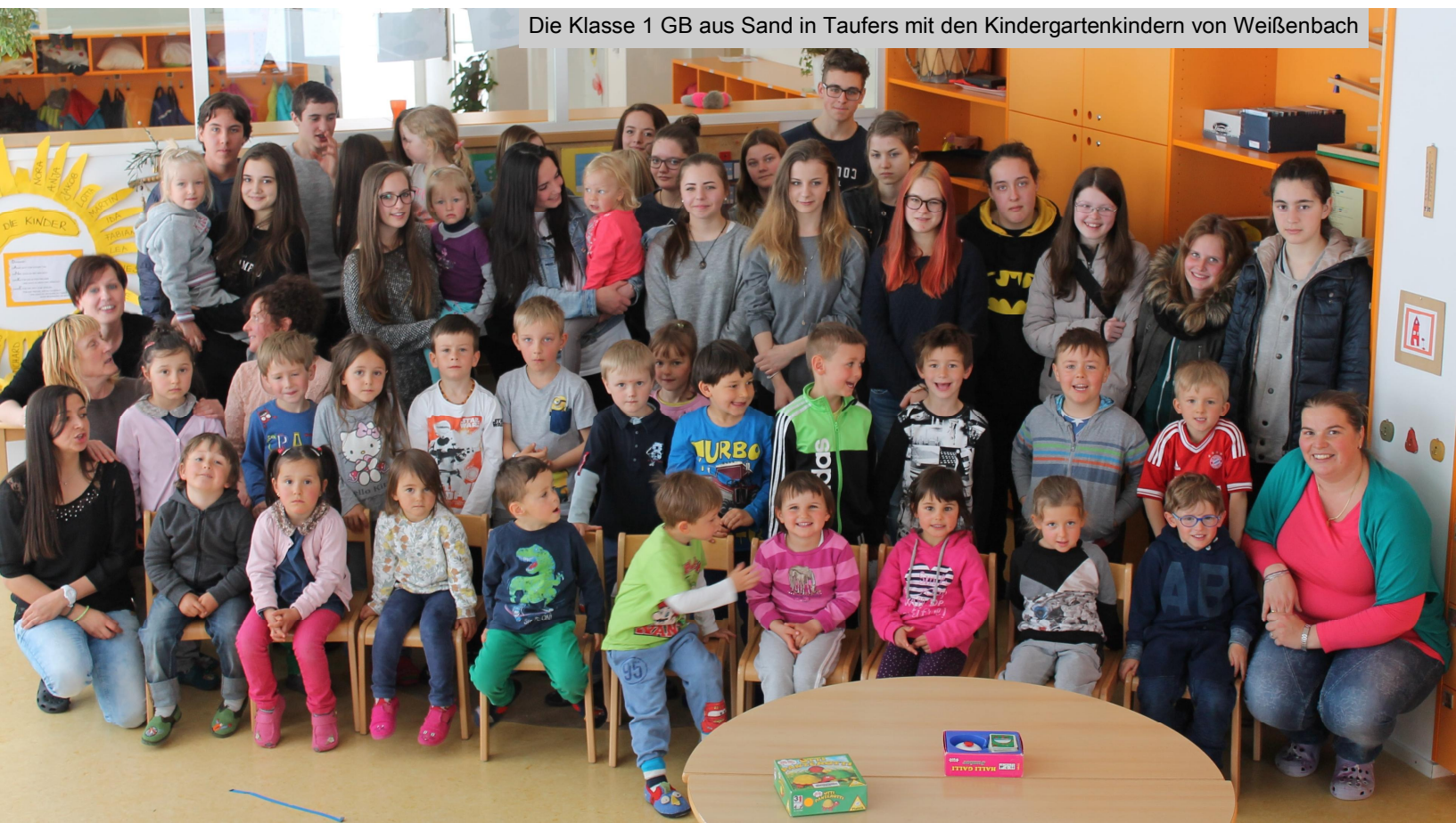
Die Klasse 1 GB aus Sand in Taufers mit den Kindergartenkindern von Weißenbach