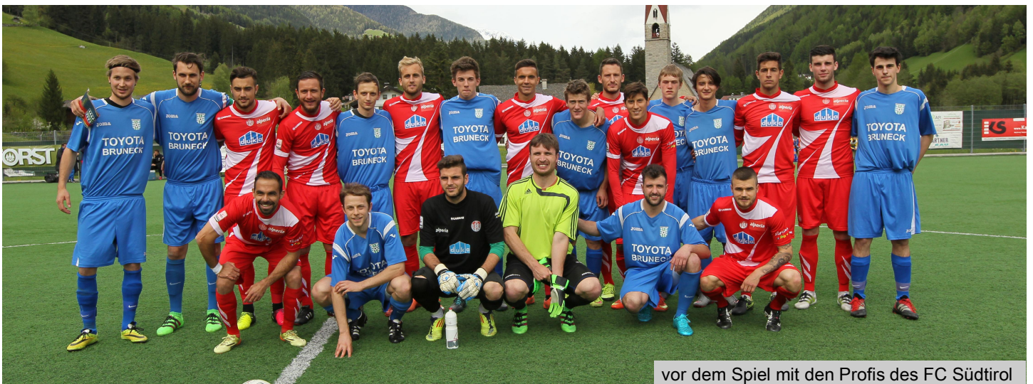
vor dem Spiel mit den Profis des FC Südtirol