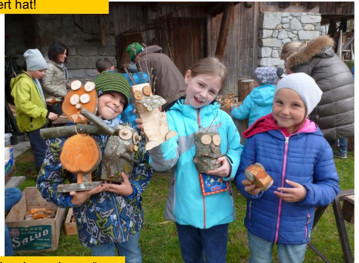
„Wer will fleißige Handwerker sehn, ...“ Ein unvergesslicher Nachmittag für unsere Kids