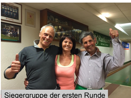
Siegergruppe der ersten Runde

Auf drei Bahnen wurde dann mit sehr viel Siegeswillen, literweise Zielwasser, vor allem aber mit jeder Menge Spaß gekgelt.