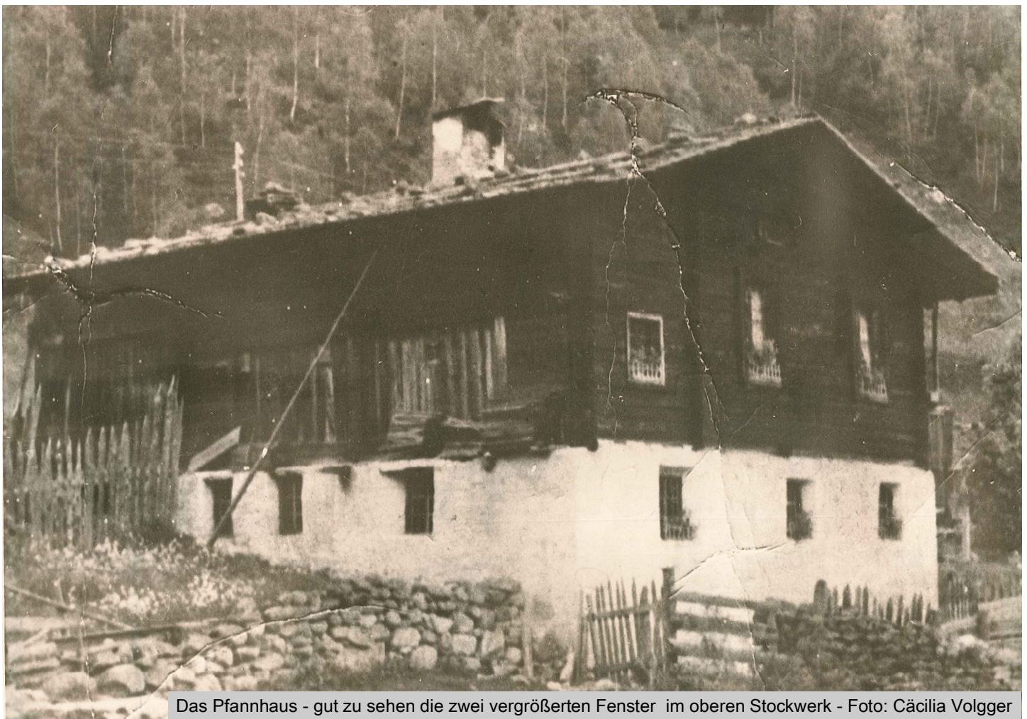
Das Pfannhaus - gut zu sehen die zwei vergrößerten Fenster im oberen Stockwerk