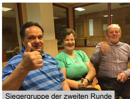
Siegergruppe der zweiten Runde