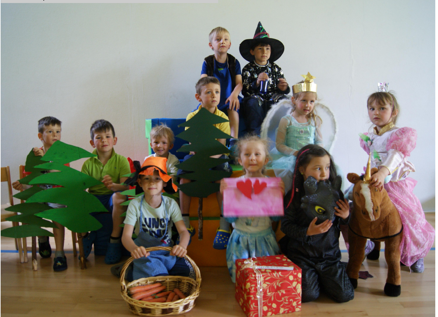
Die Schauspieler beim Stück „Die Prinzessin und das Einhorn“