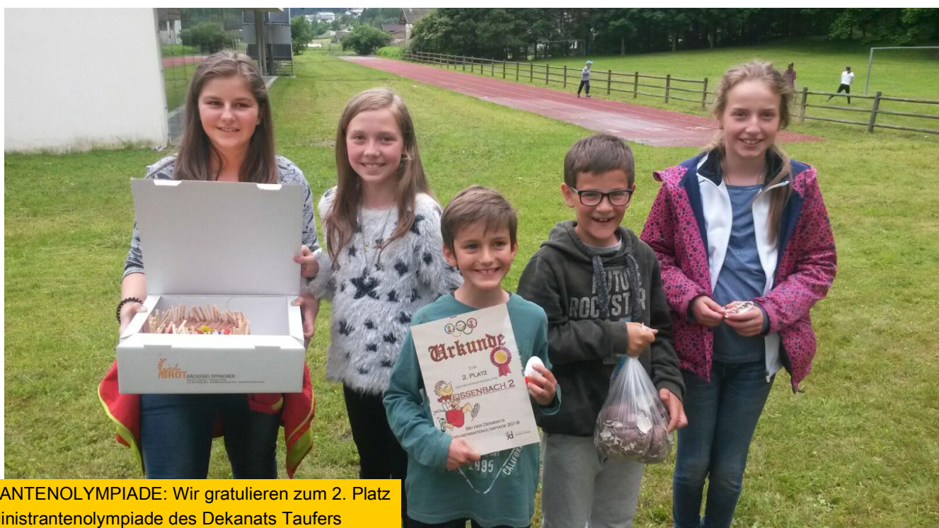
MINISTRANTENOLYMPIADE: Wir gratulieren zum 2. Platz bei der Ministrantenolympiade des Dekanats Taufers